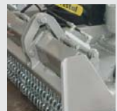
Porta traseira hidráulica.