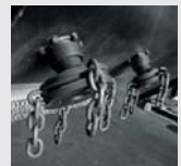
Dispositivo de corte.