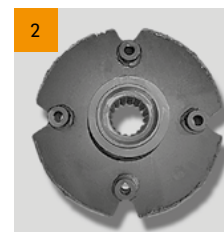
1. Sistema de engate; 2. Rotor em HARDOX Ø430mm.