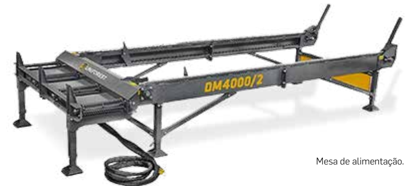
Mesa de alimentação.