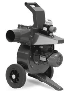
Aspirador elétrico de resíduos.