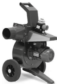
Aspirador elétrico de resíduos.